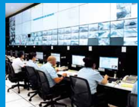
Execução da missão de prevenção imediata e de salvamento pelo Centro de Operação de Protecção Civil.