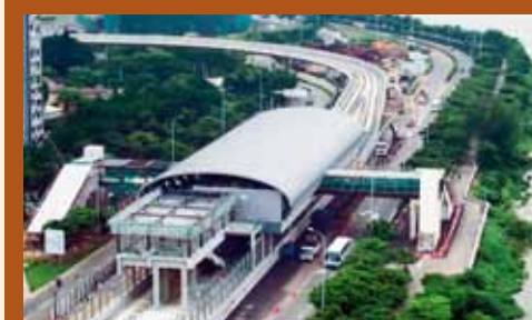
Terminal Marítimo da Taipa