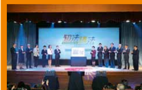
Cerimónia de lançamento do Concurso de Oratória Televisivo de Macau “Saber a lei e falar da lei”