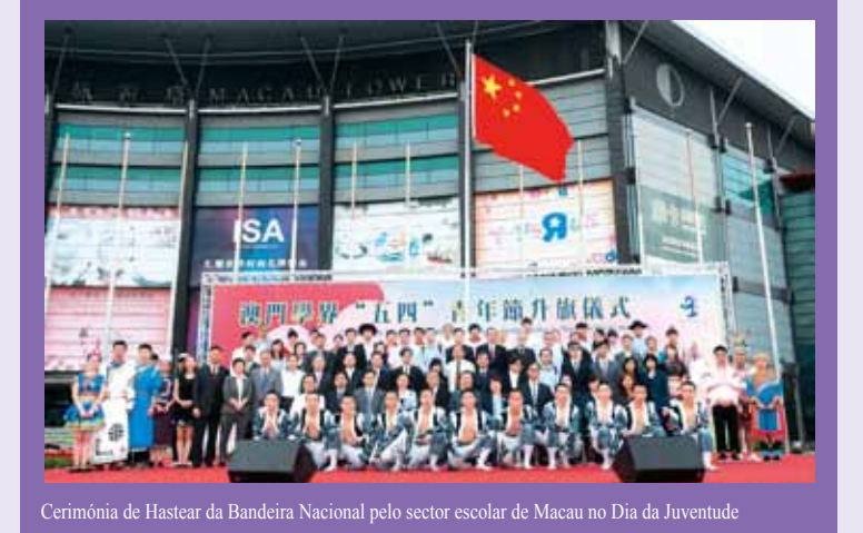
Cerimónia de Hastear da Bandeira Nacional pelo sector escolar de Macau no Dia da Juventude

Tendo em consideração, como ponto de partida, as opiniões dadas pela maioria da população e interesses de desenvolvimento a longo prazo de Macau, serão seguidos os princípios das linhas orientadoras de acção delineados pelo Chefe do Executivo “implementação progressiva do planeamento e construção conjunta de um bom lar”, envidando-se todos os esforços para concretizar os objectivos definidos nas áreas desta tutela.