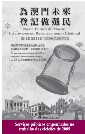
Serviços públicos empenhados no trabalho das eleições de 2009