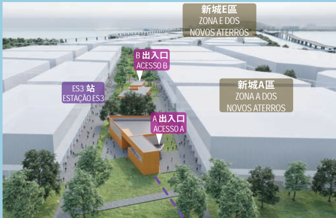
新城A區一般地下輕軌站

Durante as horas de ponta é comum encontrarem-se em Macau situações de congestionamento de trânsito designadamente nas redondezas das Portas do Cerco. Com a entrada em funcionamento da Linha Leste do Metro Ligeiro será disponibilizado ao público um meio de transporte rápido, confortável, ecológico e fiável, que liga as Portas do Cerco, as Zonas A e E dos Novos Aterros e a Taipa, contribuindo para a redução dos congestionamentos rodoviários.