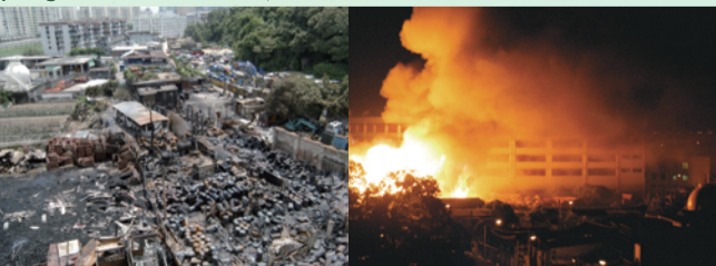
Explosão envolvendo substâncias perigosas em Tianjin