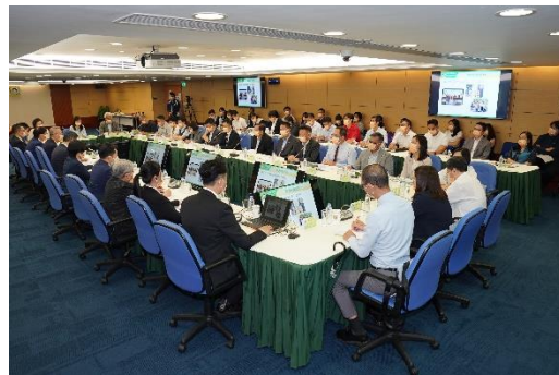
Destina-se ao ensino não superior e ensino recorrente