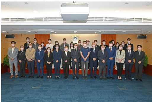
Destina-se ao ensino superior

Destinatários: Escolas primárias, secundárias, nocturnas e universitárias que participaram na “Rede de comunicação com as escolas”