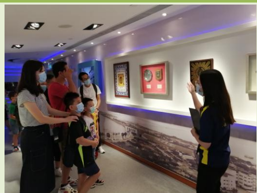
“司警教室—警務全接觸”暑期活動

於2020年8月期間，本局與教育暨青年局合作舉辦了4場“司警教室—警務全接觸”暑期活動，共56名家長及其子女參與，分別參觀了本局報案及緊急行動中心、多媒體展覽廳、模擬射擊練習場、新聞發佈室、警車裝備、詢問室及訊問室等設施，認識本局的組織架構及打擊犯罪方面的工作，增進警民之間的瞭解和互信，有效促進警民合作。